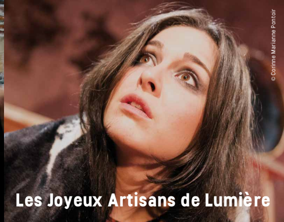
Les Joyeux Artisans de Lumière